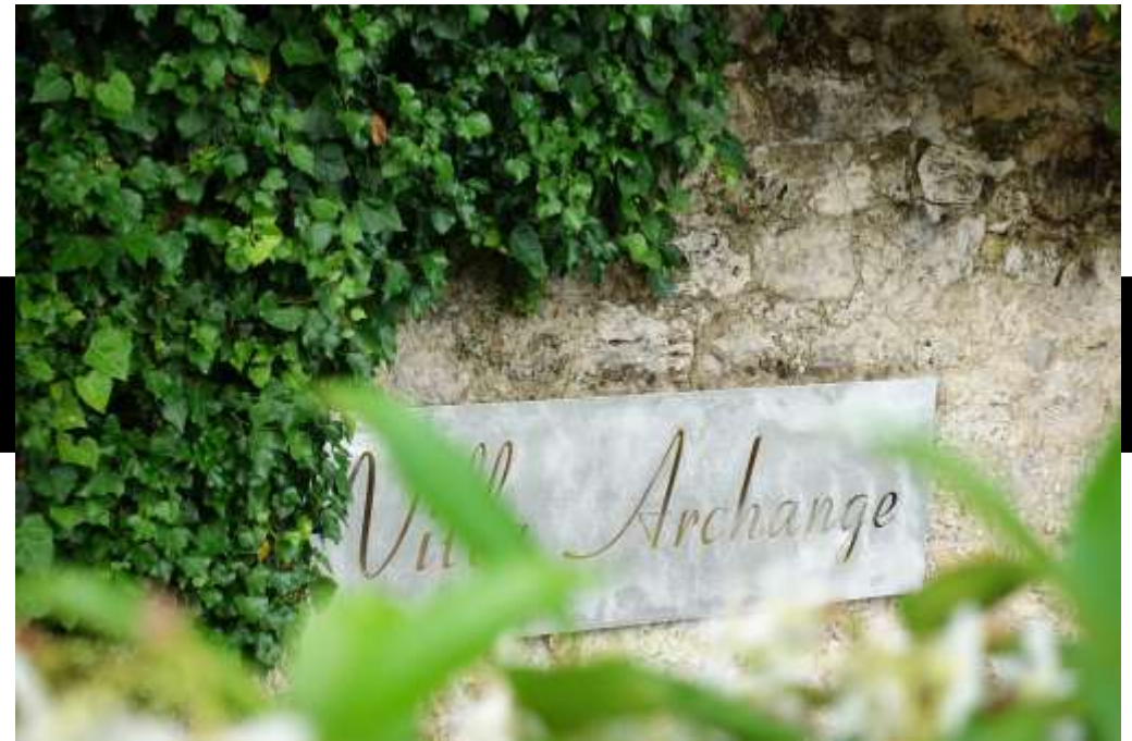
LA VILLA ARCHANGE LE BISTROT DES ANGES